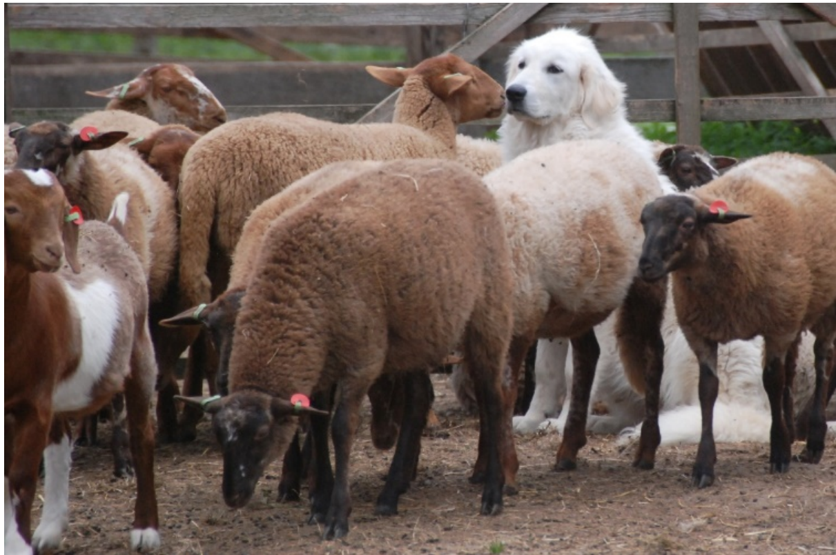
foto: pilot kuddewaakhonden Wierdense Veld in 2018. Kuddewaakhonden zijn zeker niet overall toepasbaar maar waar deze honden ingezet kunnen worden is in de regel een effectieve bescherming van vee tegen wolven mogelijk.

De bevoegdheid om daarvoor middelen beschikbaar te stellen ligt in beginsel bij Provinciale Staten. Het gaat immers om het vrijwillig verstrekken van subsidies. Bijlage 4 geeft een overzicht van geadviseerde inhoud en proces in die gevallen dat daartoe wordt besloten.