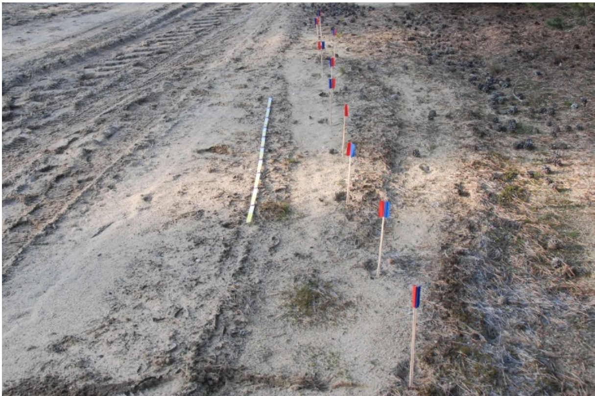
foto: mits goed gedocumenteerd kan een spoor in sommige gevallen worden geaccepteerd als bevestigde waarneming van een wolf.