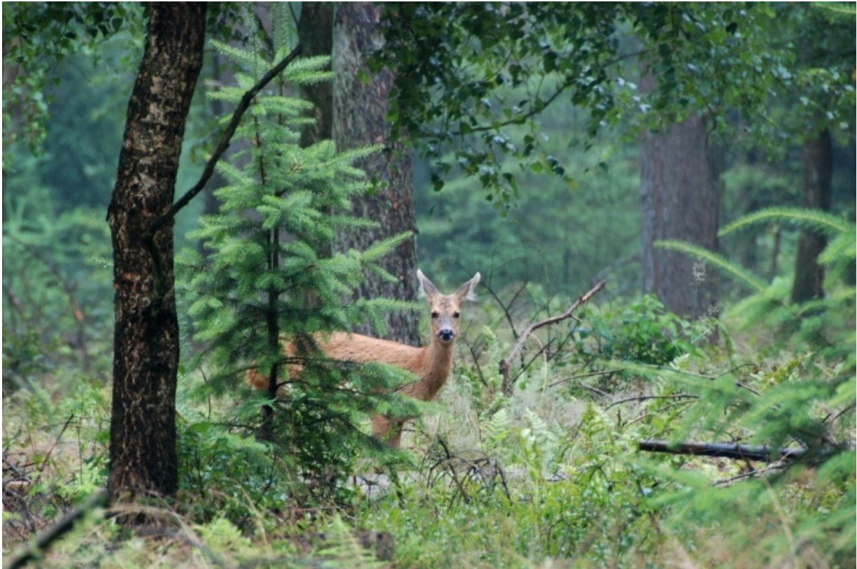
foto: Reeën zijn in Nederland de meest voorkomende wilde prooidieren voor wolven.

Onderzoeken die volledig samenhangen met het beperken van schade door wolven aan landbouwhuisdieren vallen buiten dit bestek. Dergelijk onderzoek kan al worden meegenomen via de onderzoeksagenda van BIJ12.