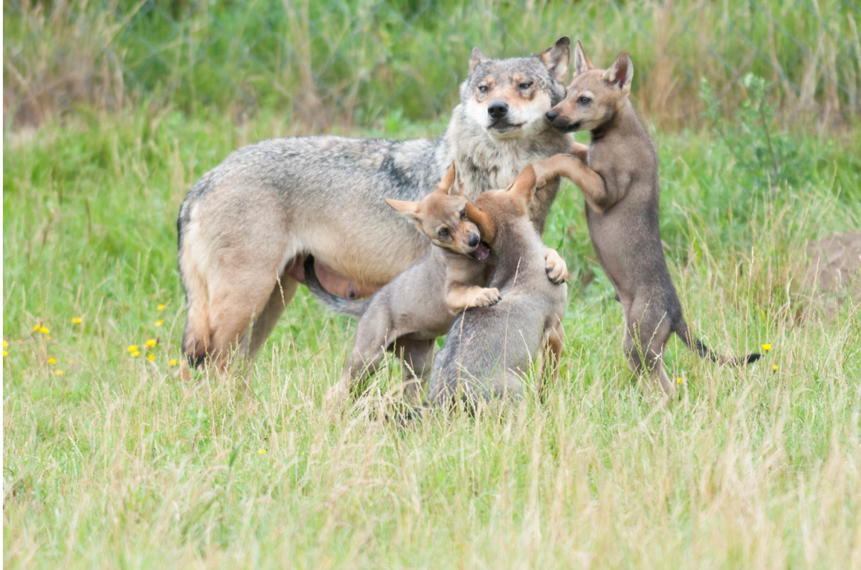
foto: wolf met jongen, dit wolvenplan gaat ook al in op de aanwezigheid van een territoriaal wolvenpaar met jongen.