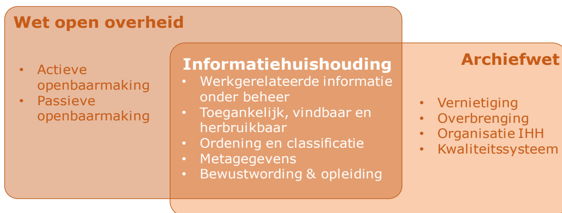
Figuur 2 – Relatie tussen Wet open overheid en archiefwet

De samenhang ligt voornamelijk in het geordend opslaan en toegankelijk houden van informatie die verplicht openbaar moet worden gemaakt of mogelijk moet worden verstrekt bij Woo-verzoeken. Daarom zijn voor dit Meerjarenplan met name deze aspecten van de informatiehuishouding van belang.