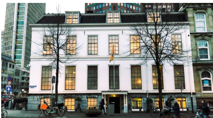
Het kantoor van het Interprovinciaal Overleg in Den Haag.

Het Interprovinciaal Overleg is de vereniging van de gezamenlijke provincies in Den Haag. Namens de twaalf Nederlandse provincies behartigen wij het provinciaal belang in Den Haag en Brussel. Het IPO zet zich in voor een regionaal sterke economie, is agendabepalend op maatschappelijke opgaven en maakt zich sterk voor een goed openbaar bestuur.