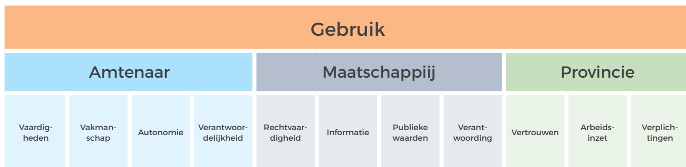
Figuur 4: Ethische aspecten bij het gebruik van ChatGPT

In 4.1 en 4.2 zijn al verschillende ethische vraagstukken aan bod gekomen. Er wordt nu ingezoomd op de ethische aspecten bij het gebruik van ChatGPT en wat dit betekent voor de ambtenaar, de maatschappij en de provincie. Deze aspecten zijn samengevat in Figuur 4 en worden daarna toegelicht.