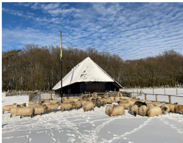
Onze schaapskooi in Blaricum

Leuk om te weten: het is weer volop lammertijd. Op onze website vind je nieuws en een leuke video over onze schapen en lammetjes.