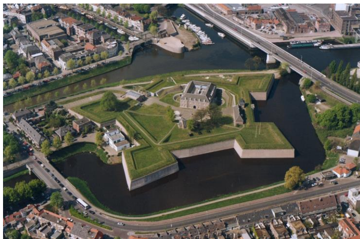
Het BHIC is gevestigd in het prachtige zeventiende-eeuwse fort de Citadel in 's-Hertogenbosch

In onze depots liggen archieven van rijks- en provinciale instellingen in de provincie Noord-Brabant, maar ook van de 14 aangesloten gemeenten en van twee waterschappen. Verder hebben wij veel persoonlijke archieven, familiearchieven, huisarchieven, bedrijfsarchieven en archieven uit het verenigingsleven.