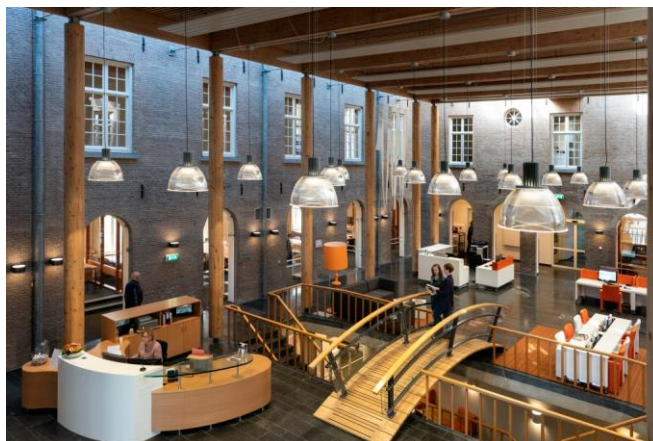
Studiezaal van het BHIC

Bij het BHIC valt zoveel te ontdekken over de Brabantse geschiedenis! Ga dus snel naar www.bhic.nl .